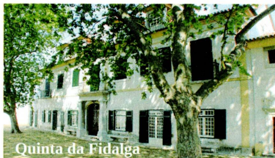
Quinta da Fidalga