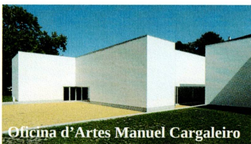
Oficina d'Artes Manuel Cargaleiro